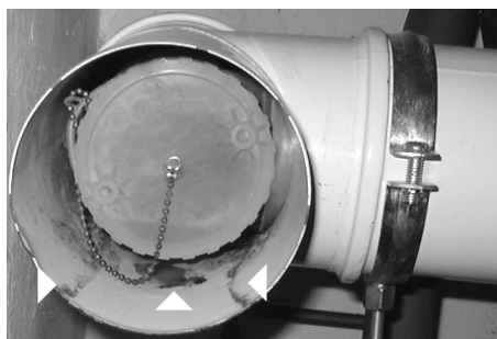
Rostschäden an einer Abgasleitung

Sonst können eventuell über die Zuluft, die von der Feuerstätte über den Ringspalt angesaugt wird, Schmutz- und Rußpartikel, sowie chemische Reststoffe, in die Feuerstätte gelangen und damit die neue Feuerstätte, sowie die Abgasleitung schädigen.